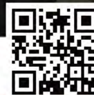
新界地區抗疫連線