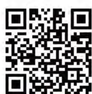
全港社區抗疫連線