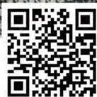
九龍齊心抗疫連線